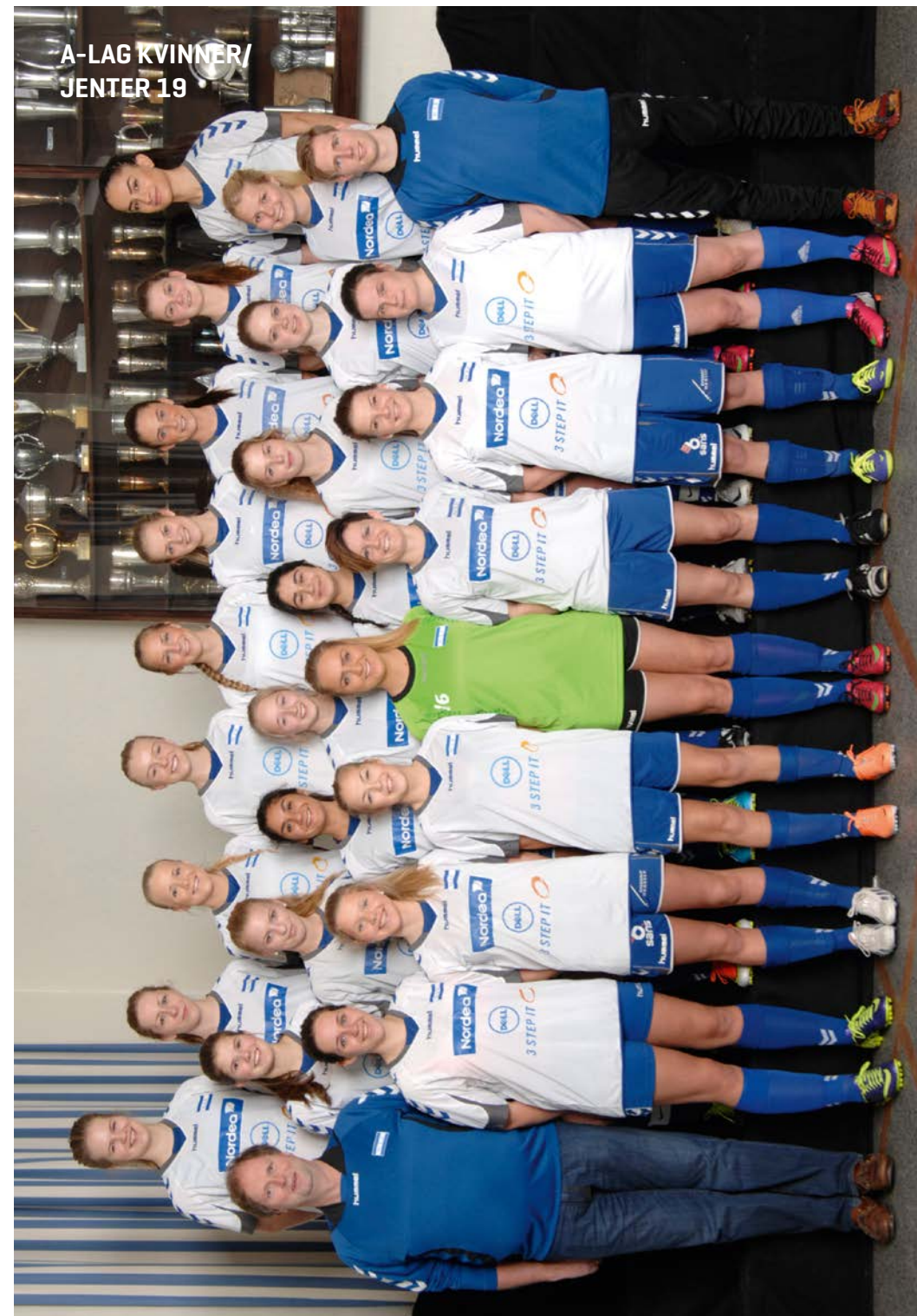
A-LAG KVINNER/ JENTER 19