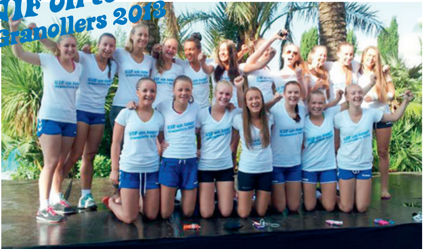
Jenter 97 hadde en flott tur til Granollers cup i Barcelona i sommer.