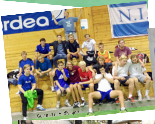
Gutter 18, 5. divisjon