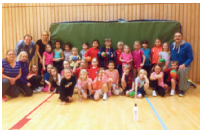
Gutter og jenter 2007

Vi er en liten spillergruppe med ivrige jenter, som trener 3-4 dager i uken og blir stadig bedre. Etter forrige sesong fikk vi et frafall på fire spillere og det er kun de ni ivrigste jentene igjen. Med tre-fire yngre spillere som helintegrerte jenter i gruppen, og nesten 100% treningsoppmøte har imidlertid jentene hatt en bra trenings sesong med stor ferdighets-