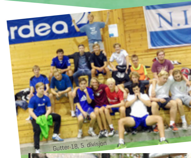
Gutter 18, 5. divisjon