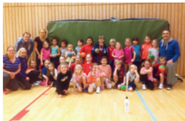
Gutter og jenter 2007

Jenter 2003 består av 49 entusiastiske jenter. Svært få slutter, og det er alltid noen på venteliste som ønsker plass på laget. De fleste av jentene har vært med oss i mange år og vi kan se en stor fremgang gjennom det siste året. Vi har spesielt fokus på å utvikle målvakter fremover. Jentene er meldt opp i fire jevne lag i øvet serie, samt et lag i øvet serie jenter 11. Alle lagene gjør det veldig bra. En utrolig herlig jentegjeng, engasjerte trenere og positiv foreldregruppe!