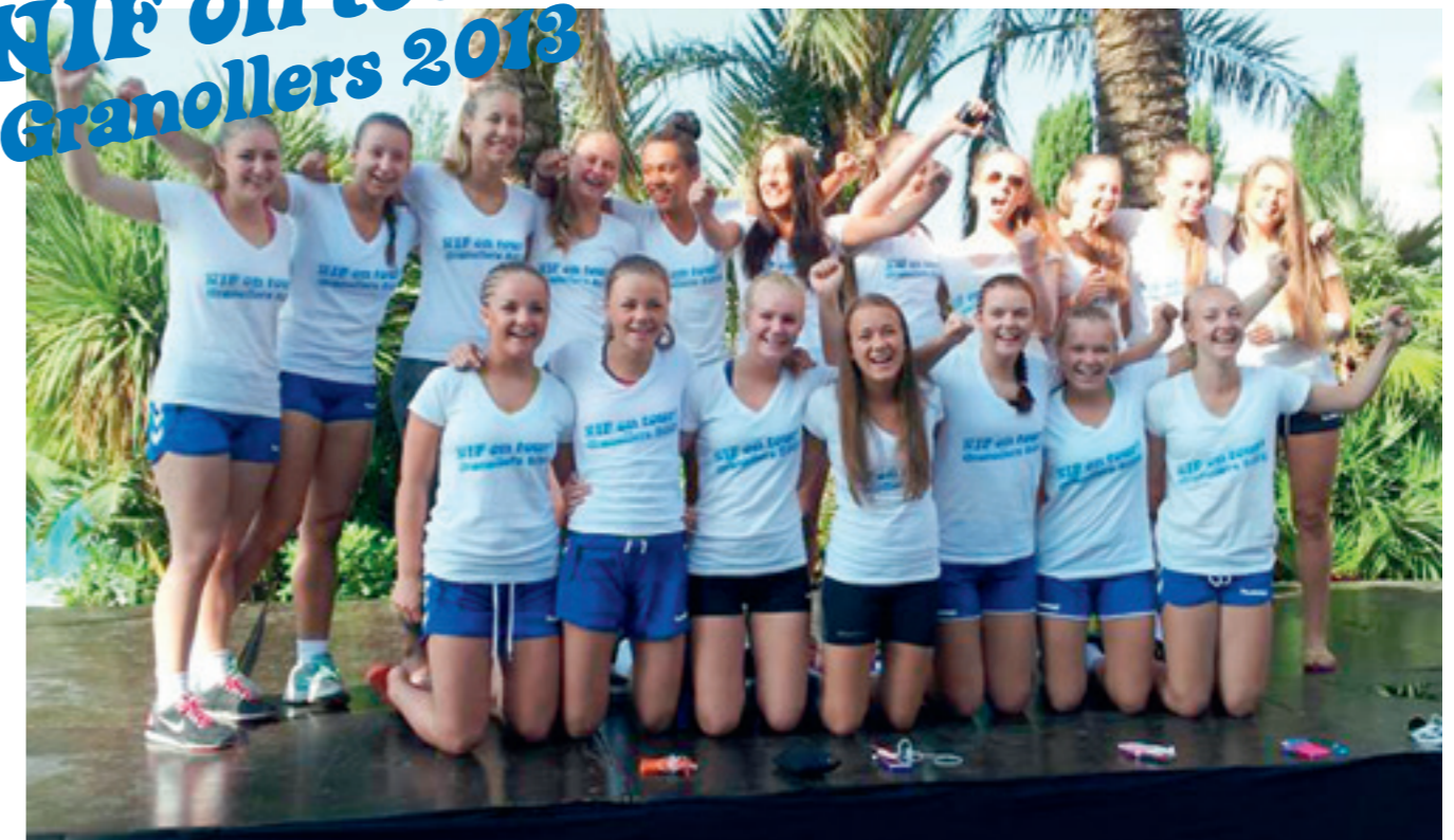
Jenter 97 hadde en flott tur til Granollers cup i Barcelona i sommer.