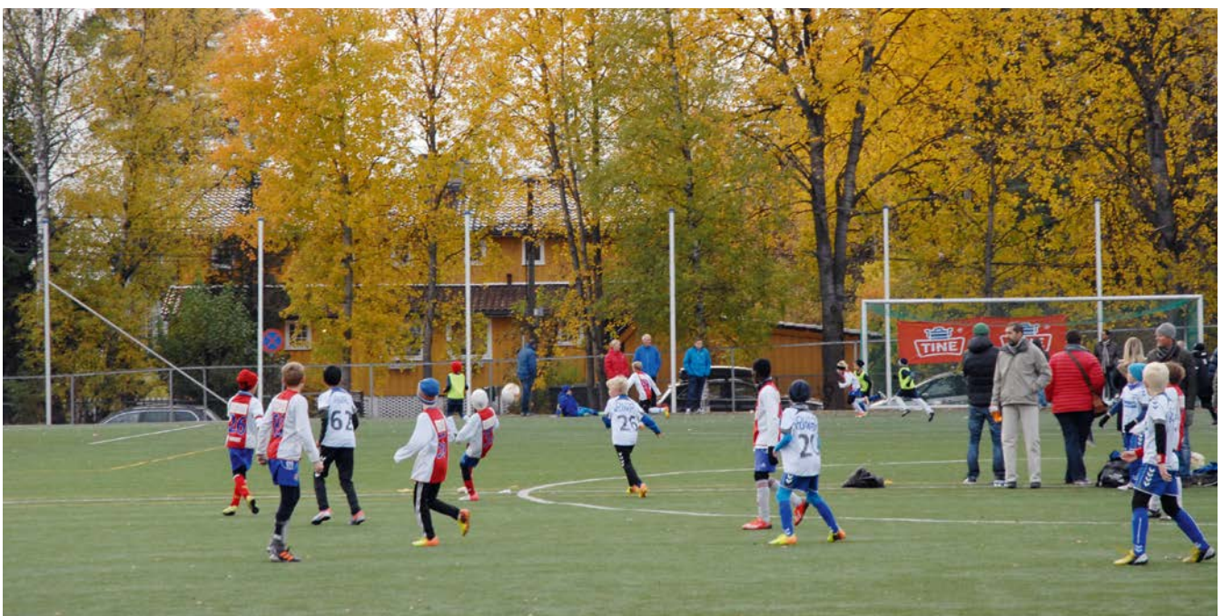
Full fart under Nordstrand cup.