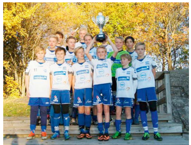
Gutter 99 kan løfte pokalen over hodet etter finalen i Nordstrand cup.