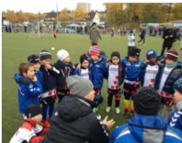
Gutter 2007, klare for Nordstrand cup.

Vi ser fremover til sesongen 2014 med ny trener, Kim Westrum og tur til Danmark første delen av påsken.