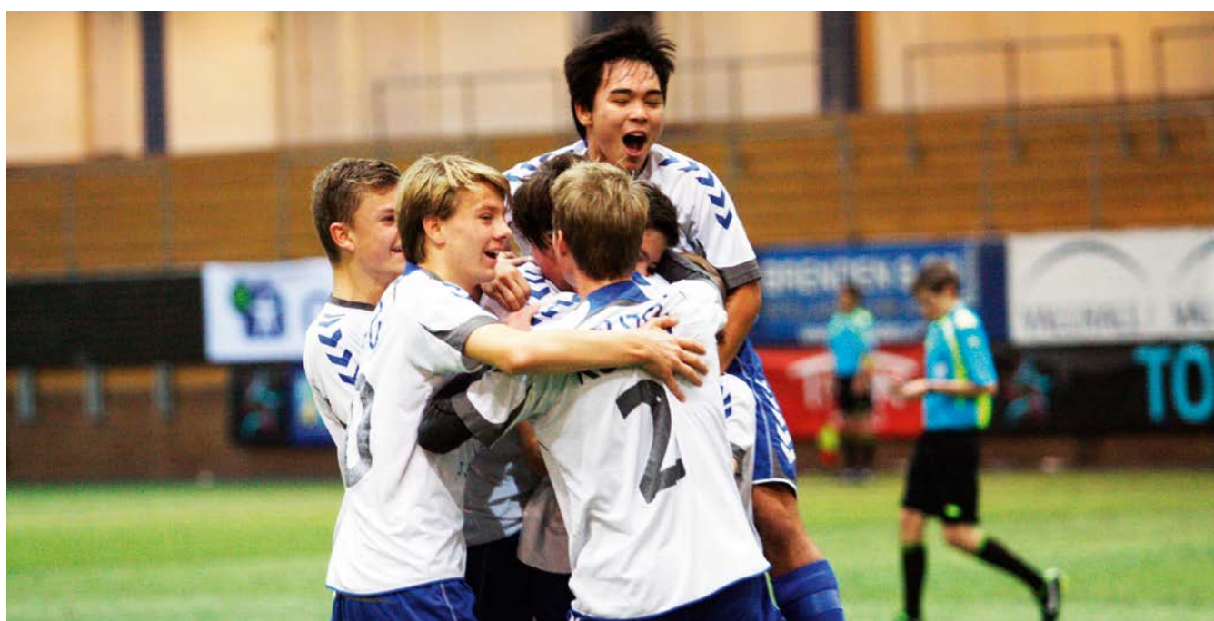
Gutter 97 ble vinner av OBOS cup og sesongens Interkrets-serie.