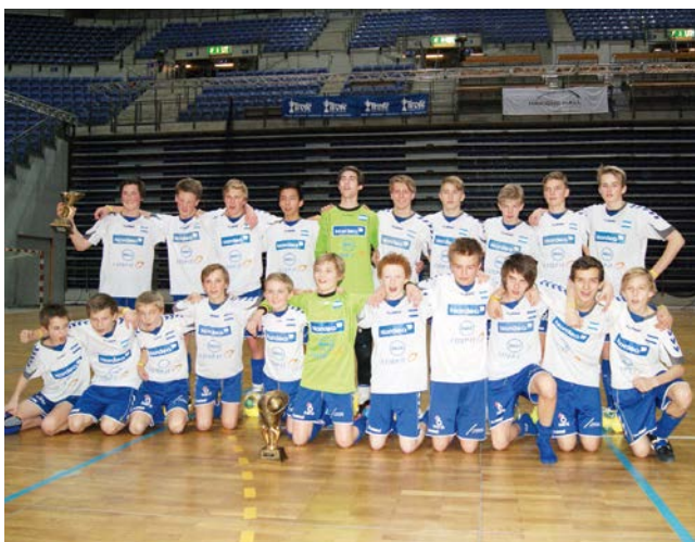
Gutter 99 og Gutter 97, begge vinnere av Lillehammer cup.

Vi har trent fast en gang i uken, og en periode hadde vi lørdagstrening i tillegg. Så lenge gradestokken ikke kryper under -10 trener vi ute i all slags vær! Treningene består av utviklende og morsomme stasjonsaktiviteter og guttene har vist en enorm progresjon. Dette er utrolig inspirerende for barna og spennende for oss voksne som følger dem tett.