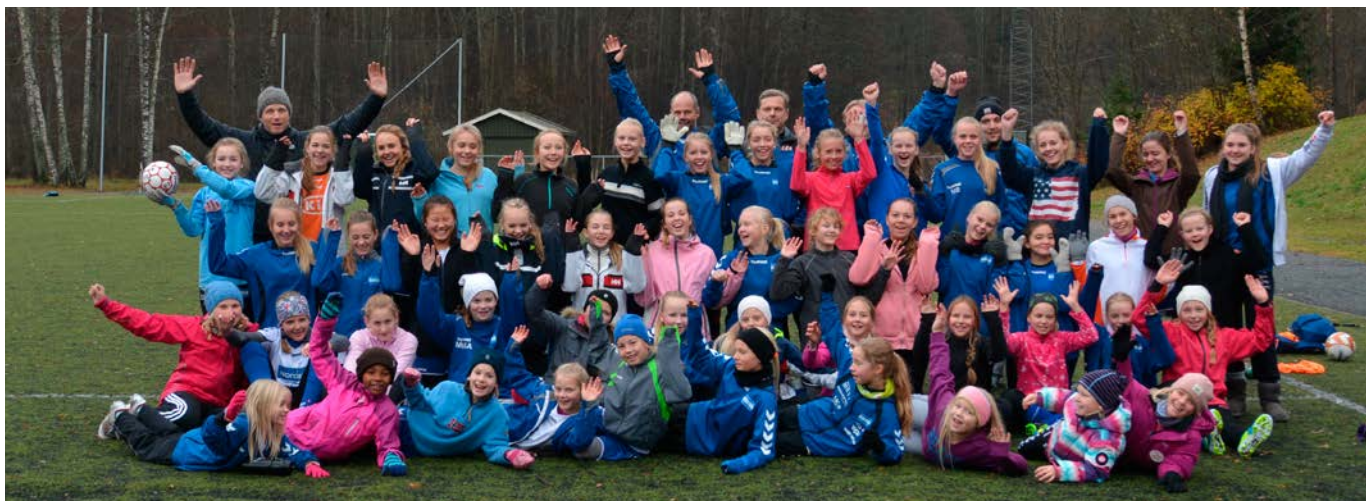
Nok en vellykket Jentedag på Hallagerbanen i november.