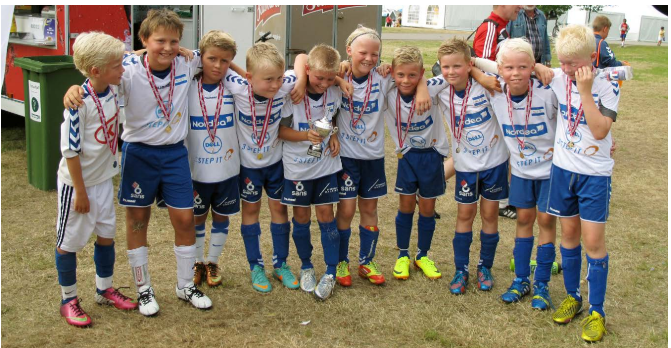
Fornøyde 2003-gutter etter endt Norway cup.