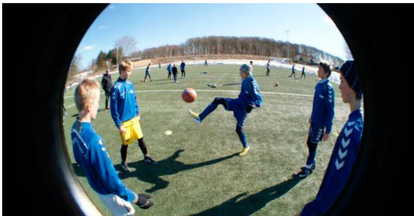
Fra årets treningsleir i Fjerritslev i Danmark.