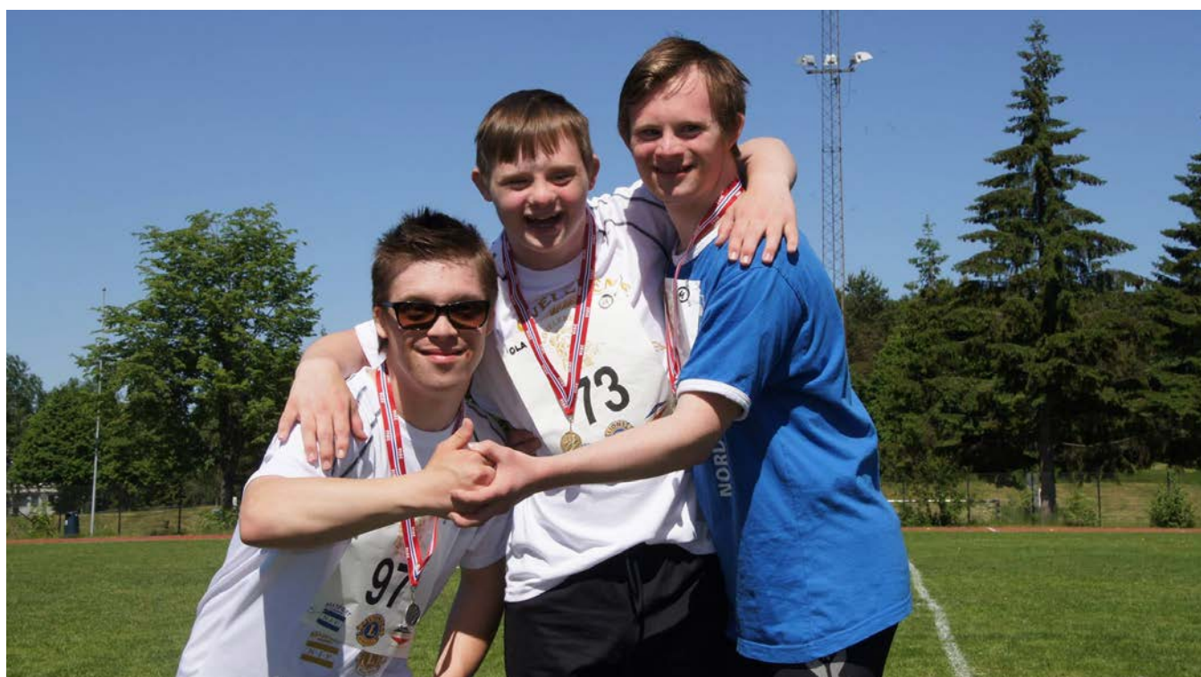
Nordstrand Allsport arrangerte i 2016 Løvelekene for 10. gang. Nok et flott gjennomført stevne med rekordstor deltakelse.

Vi har stadig måtte utsette rive- og byggestart for ny